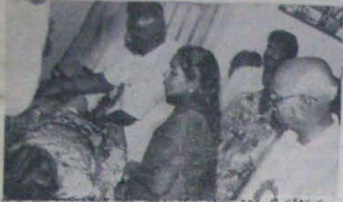
కొంతకాలం క్రితం తన దంపతులను చూడటానికి కుటుంబంలో చేరారు. వారిని చూడటం తనకు చాలా సంతోషం తెచ్చింది.