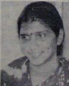
ఇప్పటికీ, అతనిపై ఆక్రమ సంబంధం ఎంత చేసి తిరిగి

దగ్గర ఏర్పడవనే. అప్పిపాస్తులు అమెకు చెందకుండా పోతాయని భయంతో ఎన్టీఆర్ పెళ్ళికోరుకున్నాడు. తిరుపతిలో ఈ ప్రయోచన వచ్చే చంద్రబాబు, మోహనబాబు తీవ్రతను ప్రకటించారు. ఇక వీరు మోహననరనే తెగింపలే. ఎన్టీఆర్ బహిరంగం పథంలో ఆ ప్రకటన చేసాడు. ఇటు వెదికే మోర వున్న వారికి, అటు శ్రీంధర వున్న జనానికి పోకే తగిలినట్లుందింది ఆ ప్రకటన. తిరుపతి నుంచి వచ్చి రాజాని మొదల దండలు మార్చుకొని పెళ్ళి చేసుకున్నాడు. తర్వాత రిజిస్ట్రేషన్ పెళ్ళి రద్దుపరక కల్పించారు. రిజిస్ట్రేషన్ పెళ్ళి రద్దుపరకను రిజిస్ట్రేషన్ పెళ్ళి రద్దుపరకను రిజిస్ట్రేషన్ పెళ్ళి రద్దుపరకను