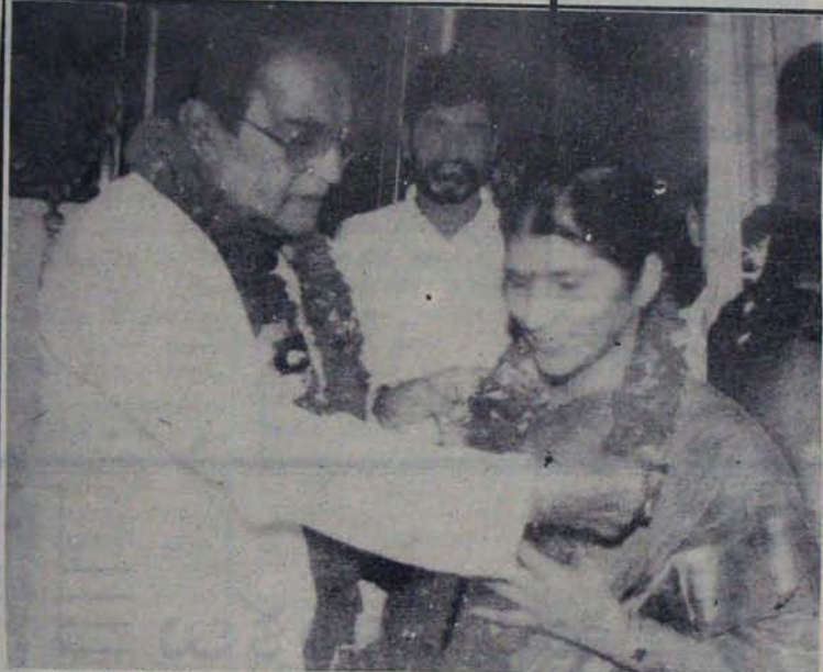
పూలదండం మార్పిడిలోనే కొత్త భార్యను ఎంత అర్థంగా స్వగృహం మైదునున్నాడో చూడండి మునుది తెలిసి పొరుగు

అయిన వంతుం పర్వనాథం తన ఘోషా వచ్చి తనలో దేవులు కలిసాడన్న ఆనందంతో స్వయం చిరిక ఆహ్లాక వాసం వీడి పూరరావూరుకు వచ్చిన ముద్దగడ వైఎస్ కు కలవరం. కొంత గి పేజీలో