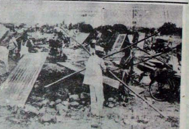
...జాలి గాయు గోడలు