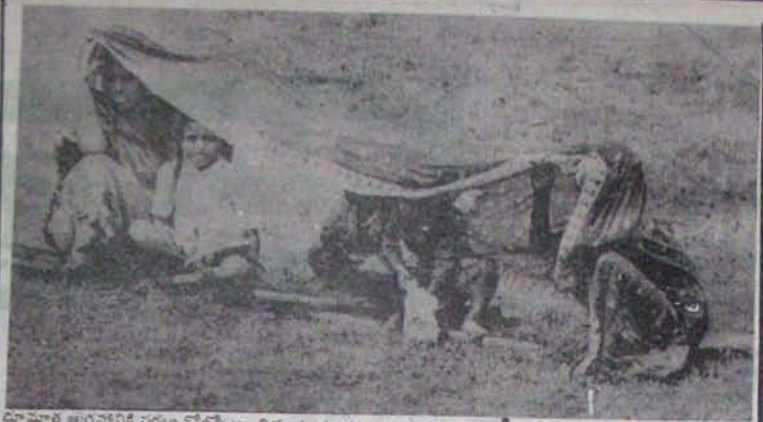
సామాజిక అగ్రహారానికి సర్వం కోల్పోయి, దీర్ఘమైన సూర్య ప్రకాశం నుంచి రక్షించడానికి తన దీనినే గొడుగుగా పట్టిన ఒక అలాగూ తల్లి దీనస్థితి; థిలాబీలో చచ్చిన వారి సుఖపడి పోయారు; బ్రాతిరుండే వారు ఇట్లానే వచ్చినారుగా

30 తరం అర్ధరాత్రి వాటి వెనుక రూపం ఘోరమైనది ప్రవేశించి సమయంలో వెళ్ళిపోగా, ఏ పూతలం ముందు పాల్గొని లేకుండా వెళ్ళి పోయింది పూలం. వేల వెళ్ళి