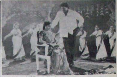
పోలీస్ లాకప్ తో చినోడ్ కు మార్కెట్ విజయకాంత్

ఆ దృశ్యనిర్ణయం వెనుక ఎంతటి ప్రణాళికలు, పథకాలు వున్నాయో ఆచారంకోసమే అర్థం అయిన సదాశయాలు గుర్తించి, ఆయన బాటలో పయనించాలిని ప్రతి ఒక్కరిమీదా కూడా వుంది. తెలుగు సినిమా