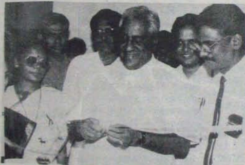
7.12.92 నీకవిదాగాన్ని ప్రారంభిస్తున్న ముఖ్యమంత్రి శ్రీ నేదురుమల్లి జనార్దన రెడ్డి