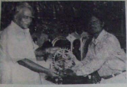
జేపీఎల నెలవారీ అధిగమన పనులకు పాఠశాలలో వారు వెలి సోమయాజులు సుందీ కీర్తి అంధులకు ముద్దు కీర్తి నాణం