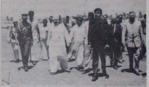
గవర్నర్ జెసి కృష్ణకాంత్ను స్వాగతిస్తున్న కలెక్టర్, ఇతర అధికారులు

24 తేదీ మధ్యాహ్నం వచ్చి మామిడి అధ్యక్షుల కలెక్షనుంది. ఈ కాగానే, గవ్ జాకో తనను కలవన సమయంలో ఈ ఉద్యమం విఫలమై