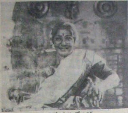
పెళ్ళిగోల చిత్రంలో కారద