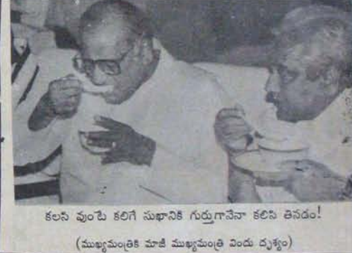
కలసి వుంటే కలిగి సుఖానికి గుర్తుగానేనా కలిసి తెనడం!

"నాయుడు గారు రాహులు వాకు కొత్తదేమా కాదు. గతంలో ఏనుమరణాంతరం పరిశుకురుగా నెల్లూరుకు వచ్చి ఆనం సంజీవరత్తి గారి అభ్యర్థిత్యాన్ని సహాయం చేసి, నిబ్బడిగా గెలిచేందుకు అవకాశం కల్పించింది నేనే గదా" అని క్రికీట్ల అన్నారట. అందుకు నాయుడు పట్టు వరలకుండా "మారు గనక రాహులుకు వచ్చి ఏకగ్రీవంగా గెలిచింది సంపూర్ణా" రట. నాయుడు గారి ప్రతిపాదనకు "క్రికీట్ల" అన్నప్పటికీ ఆ అవకాశానికి