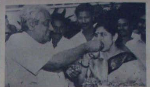
కన్నుల కదలాడి గొంటి మాపు అంతరార్థం... కేసు తిప్పివినందుకు కృతజ్ఞతా భావనా... కోరనున్న 'రాజ్యలక్ష్మి' పగం వాటాకు సంతకమా?...