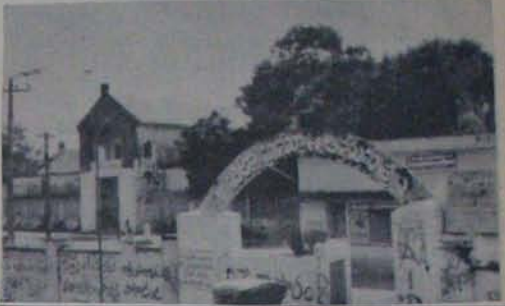
నతీందర్ ను తెచ్చి ఈమెకు పెట్టారు. కొద్దిసేపటికి ఇద్దరు లోగులు చనిపోయారు. సమయానికి నిలవడం లభ్యమైవుంటే, కనీసం ఆ రెండవ యువశక్తి అయినా ప్రతికీవుండేది.

గతవారంలో నెల్సన్ దేవుడు యువశక్తి కాన్సుకోసం ఆస్పత్రిలో చేరించారు. అవసరమే చేసి తిరుగు తీయాలని రాక్షసు నిర్వారించారు. కాని ఆ తర్వాత అమెను అక్కడ వదిలిన వెళ్లి పోయారు. సాయిత్రం అమెను వెళ్ళులు వచ్చాయి. సమయానికి రాక్షసు లేదు. నర్సులే పురుడు పోసికారు. కాన్సుచేయడంలో లోపం వల్ల బీడింగ్ ప్రారంభమైంది. అత్యవసరం మందులు ఇవ్వడానికి కనీసం స్టోకరం కాళం కూడా లేదట. ఆ యువశక్తి కోమలోకి వెళ్లిపోయింది. సూచించుచుండేకను పరిస్థితి అమె వచ్చినా, ప్రవారకరంగా వుందని మాత్రం చెప్పి వెళ్లిపోయిందట. ఆ తర్వాత రాత్రి కెప్పలో యుగ్గోపి రాక్షసు వచ్చి పరిస్థితి గమనించి, అక్కజన్ పెట్టాలని చూస్తే యువశక్తిని లోపల వచ్చి మరొక రోగికి తగ్గి విన