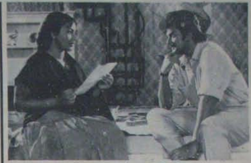
శ్రీనివాస లక్ష్మీనివాస వరుణాశ్రమ, అంబ