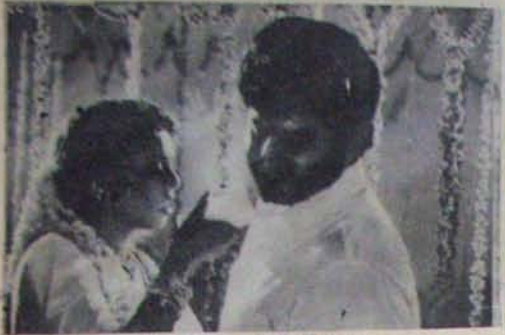
రెండేళ్లనూనాలో నువ్వని నగ్నా