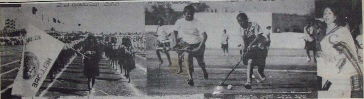
నెల్లూరు మహిళా శ్రీదేశికాల ప్రారంభంలో మార్కెట్ ఫైన్ల చేస్తున్న నెల్లూరు శ్రీదేశికాలిలు; పోటాపోటా జరిగిన గుంటూరు - వరంగల్ హాకీ పోటీలో ఒక సన్నివేశం ఇందులో గుంటూరు జట్టు సన్నుర్వగా పాల్గొంది ; పోటీలకు ముగింపు వచ్చుతున్న శ్రీదేశికాలిలో గీతారెడ్డి

ముఖ్యమంత్రి పదవిని వదిలి తిరిగి శింద్రమంత్రివర్గంలో చేరాలని మాజీ ముఖ్యమంత్రి నాదెండ్ల భాస్కరరావు ప్రచారం చేస్తున్నారు. కోట్ల శింద్రానికి వెళ్లి ఆ తర్వాత తానే ముఖ్యమంత్రి అన్న దోరణిలో అసెంబ్లీ లాటిల్లో ఎమ్మెల్యేలతో ముచ్చటించడం కోట్ల వర్గానికి ఇబ్బందిగా ఉంది.