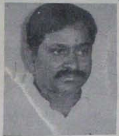
అయినపై చర్య తీసుకోవడం కుదరని పని.