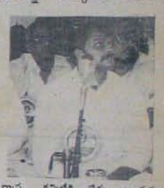
రాష్ట్ర కమిటీకి లెదు అందువల్ల క్యాబినెట్ సమావేశంలో రవీంద్రరెడ్డి బహిష్కరణ కోరుతుూ తీర్మానం చేసి ప్రధానికి పంపాలని కోట్ల తల పోస్తున్నాడు. కానీ అది అనుకున్నంత సులువుగా అరిగిట్టు లేదు. రవీంద్ర రెడ్డికి