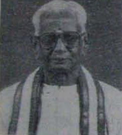
మనోరమితం' అనేది నర్తక జనాభా పాఠాంశమని అనడం తెలుసుకోవాలని ఆయన కోరాడు

కథానాయక లీకే కేవలం హీరో, హీరోయిన్లను ఆధారం చేసుకొని పాటలు, సైట్లతో పాటు ఆధారం వరకు లేని కృంగార నన్ను పాటలు కోప్పించి కుటుంబ సభ్యులకారని చూడలేని చిత్రాలు వస్తున్నాయంటే తీర ఆనందం వెంటాడు. పాటిన కల్పనను ప్రతిబింబించే చేస్తానని చిత్రాల వల్ల మన ప్రాచీన సాంస్కృతిక సారాన్ని ఎక్కడ తుకం చాల్చి మరచి పోతారనని భయం ఆయన మనలో వ్యక్తమయ్యింది. దేశంలోని పలు దుగ్గుతులకు పనిచేసే కారణమనడం దాదాపుగా గాక మరచిపో; దినాననే ద్వేయంగా సమాజాన్ని క్రమ పట్టించి విజయం సాధించమని పిలిచేవులు చిత్రనిరంధం తగదు. 'నర్తక జనా