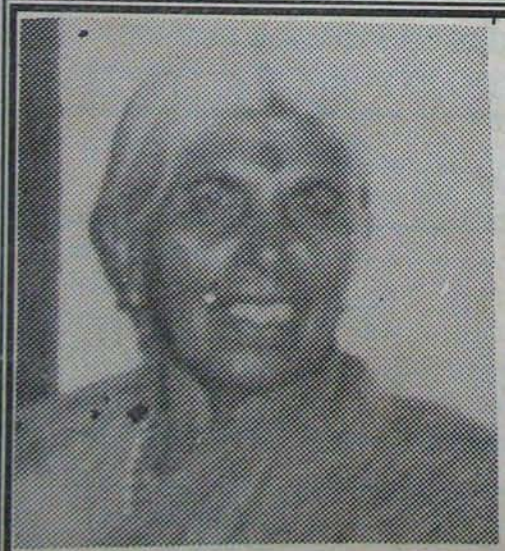
జననం : 1911 మరణం : 1933