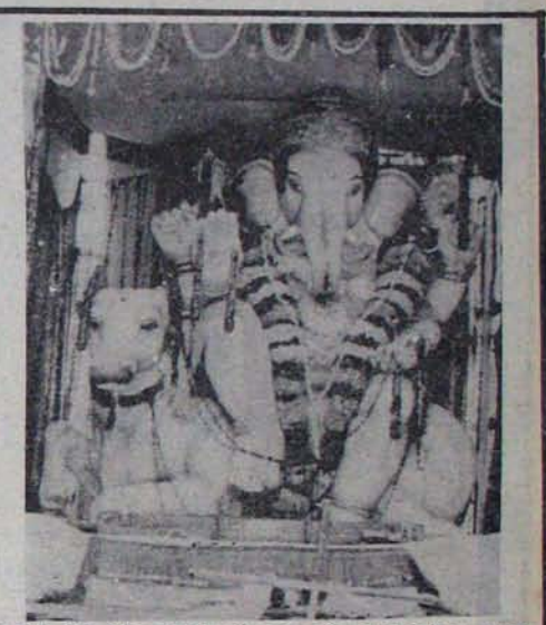
పినాయక చవితి ఉత్సవాల నిర్వహణలో హైదరాబాదును మించి పోతున్నది నెల్లూరు. మండలపరిషత్ సేత్రవల్లం చేస్తున్న నందివాసాహుళితై నగణపతి

అదగలేదు. ఇంద్రవేరికిలలు రావడం కూడా ఇదే ప్రధమం మొదట వచ్చిన ముగ్గురు వాలక గుడువారం అదనంగా లొంబాయినుంచి క్రిమతి ప్రతిపా పాదిలోను పంపారు. ప్రధాని ఇటువంటి నిర్ణయాలు ఎందుకు తీసుకుంటున్నారో అనుభావం. అయిన ఉద్దేశ్యమేమిటి? ముఖ్యమంత్రిని కొనసాగించాలను కుంటున్నారా? తొలగించాలను కుంటు న్నారా? ముఖ్యమంత్రిని కొనసాగిస్తూ, అసమ్మతియులను దువ్వడం అయిన అలోచనా? లేక తొలగింపు నింద తనపై పడకుండానా? ఈ నాటకమా?