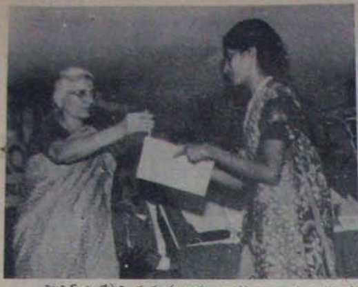
విటమిన్ ఎ లోపాన్ని మునుగూ, కాదులు వారంతా ద్వారా పూరించడంలో చేసిన కృషి గవర్నర్ సచివాలయం ముఖ్య కృషికాంక్ష ద్వారా ప్రకాశం పుత్రం కృతజ్ఞతను తెలుపుతున్న సమయం.