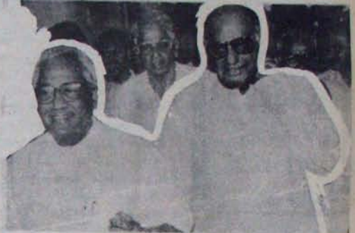
కూర్పుండ ఆ ఇంట 'కుర్చీ' వుందనా, వెంట సాగడం?

నుబ్బరామిరెడ్డిని తన అవ్వరిగా ప్రకటించిన బనారసరెడ్డి; అప్పటికి సైదరాబాదు చేరిన విజయభాస్కరరెడ్డి కార్యకలాపాలు గమనించి, ఆంతర్యం ఆర్ధం చేసుకొని, హనుంబు పేరును తన మనసులోనే దిగిపొంగివేశారు. ఇప్పటికీ చాయిస్ ఆయనకు వదిలి వ్యక్తంలో చాగుంటు సుబ్బరామిరెడ్డినే ముఖ్య మంత్రిత్వం వేరస్తుందని ఆంతర్యుల భావన. కాని, సిఎల్పీలో ఆధాస్సు పున్నప్పటికీ ఎందువల్లనే నిర్ణయం ఢిల్లీకి వదిలి పెట్టారు. పరిశీలకులు పెచ్చి, సమాచారం పెట్టెటప్పటికీ మెజారిటీ బనారసరెడ్డి వ్యక్తంలోనే వుంది. 120 మంది ఎమ్మెల్యేలు ఆయన ప్రక్కన కదలిక లేకుండా నిలబడ్డారు. పదవి పరిత్యజించిన తర్వాత కూడా అంత సంఖ్యను నిలబెట్టుకోగలగడం బనారసరెడ్డి కోర్కెకే చెల్లించింది.