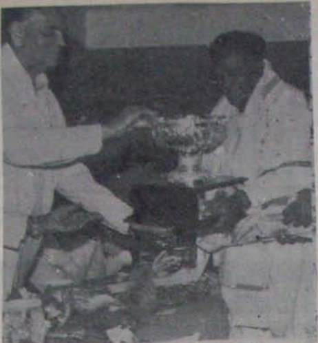
వెంటు అధిపతిని కేంద్రంగా కృషిచేసినందుకు గాను జాతీయ స్థాయిలో కేంద్ర సాహిత్య అకాడమీ వారి వ్యవహార కమిటీలో ప్రత్యేక డిప్యూటీ సెక్రటరీ పాత్ర వహించిన వారిని అభినందిస్తూ కేంద్రమంత్రి శ్రీ బలరామ్ జక్కెర్