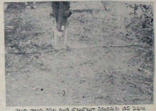
చెట్టుకు నాలుగు చేతులు సుందరి బొట్టుబొట్టుగా నిరంతరమన్న డ్రీమ్ వైపులు

ఎందువల్ల ఈ పరిస్థితి? సాధారణంగా తారురోడ్లు వాటి క్రిందున్నవట్టితీరు సరిగా లేకుంటే వానకు క్రుంగి, బ్రదులుగా పగిలి, కొరవ 11 పేజీలో