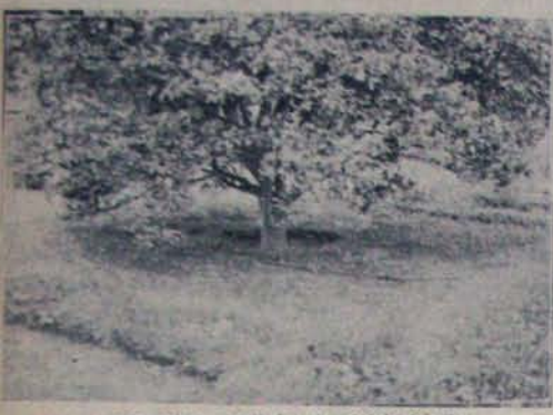
డ్రీమ్ ఐరిషియన్ వద్దతన నీరు కట్టుకుంటున్న నిమ్మచెట్టు