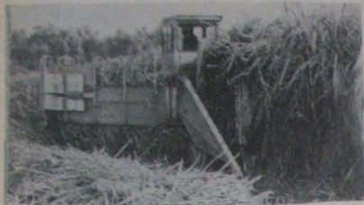
థాయిలాండ్ లో చెరకును కొడుకున్న యంత్రం