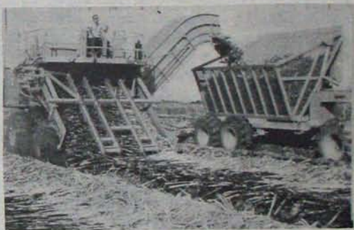
చెరకు గడలను ముక్కలు చేసి వాహనానికి లోడ్ చేస్తున్న యంత్రం

ఏ ఎరువులు, ఏ మోతాదులో వేయాలి? రూపాలలో విస్తరించినైతేల పొట్ట కల్ప తలని పోతున్నది. దానివల్ల ఎరువుల వ్యక్తంగా తయారు కావడం థాయిలాండ్ వాడకంలో పూర్ణా అనిది వుండదు.