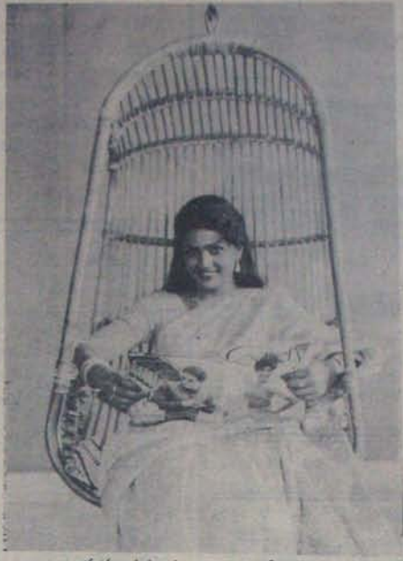
యముడన్నకు మొగుడులో నిరోష