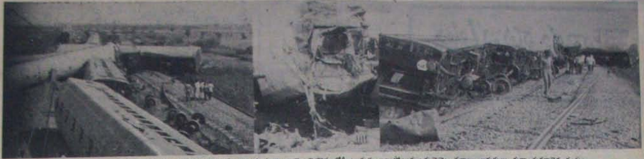
20 తది రాత్రి ప్రమాదానికి గురైన తిరుమల ఎక్స్ప్రెస్ ప్రమాద దృశ్యాలు. చెల్లాచెన్నై వోగిలు, మర్రి అయిపోయిన ఒక పెట్టె చక్రాలు. ఇరుసులు తునా తునకాలైన దృశ్యం