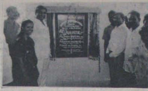
నగరవాత గ్రామంలో వెనుకబడిన తరగతుల వాసింగ్ కాలనీ ప్రారంభిస్తున్న మంత్రి శ్రీ మారోటి జానకి రాం.