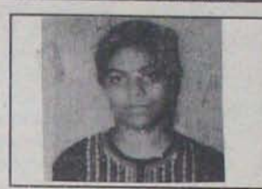
897/1000 వ. ఉమ