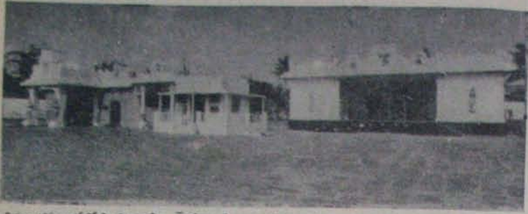
నెల్లూరులో పైవేట్ స్కూల్ కి బిల్డింగ్ పనులు చేపట్టిన అలంకారంగా నిర్మించిన కళ్యాణమండపం.