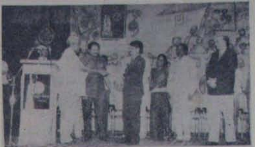
9వ తేదీ ఎన్.స్పెడియం విస్తీర్ణం కోసం 50 అక్షర చెక్కును కలెక్టర్ కె. రాజుకు అందజేస్తున్న ముఖ్యమంత్రి జనార్దన్ రెడ్డి. క్రింద మంత్రి కన్యారాజ్యవార్యులు. ఎమ్మెల్యే కుమార్ పద్మలక్ష్మి, ఆనం రామ నారాయణ రెడ్డి, ఎమ్మెల్యే కె.కె.రెడ్డి

వ.అ.36 ఈ రకము పంటకాలం 110-120 రోజులు. గింజ పొడవు నాణ్యత గరి దిగుబడి ప్యాకునుకు 6-6.5 బిచ్చుల పచ్చిగురు జిల్లా పంటలు. మంగ్రో వైరస్, అధ్యక్షి పంటను తట్టుకొనలేదు. రాజి కాల వరిమికి 115 రోజులు. ప్యాకునుకు దిగుబడి 5.5 -