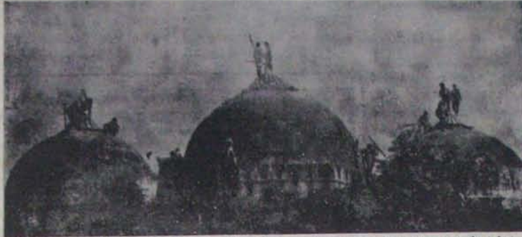
1990 అక్టోబరు 30 తేదీ కరనేపకుల ముట్టడికి గురై కూడా విద్యంసం కాకుండా నిల్వై బాట్రి మనదు

అయితే మాత్రాన్నిం ప్రాంతాన్ని విస్తరించు మేరకు నయ్యవలసిందిగా ప్రభుత్వం కాపాడుతూ వచ్చాయి. నేటినుంచి అనే ప్రభుత్వాల మనకు పునర్నిర్మాణానికి కంఠం దాచాలి. ముఖ్యంగా విస్తరించు రాయలసీమ ప్రాంతం దీనిని రాజకీయ విచారం, నేటినుంచి రాయలసీమ రక్షణ అనే దీనిని రాజకీయ అయింది. ఒక్కోకాలో పరిస్థితి కాదు. మరలై పోయింది. దీనినించి గతేది భారత దేశ మత సామరస్య చరిత్రలో ఒక కఠోక పుటగా మిగిలిపోయింది. ఎప్పుడో ఒకప్పుడు ఆ హారం బద్దం మనదని అనుకుంటున్నాం. కాని అది ఇంత