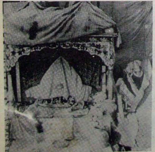
మతం రామాలయంలో ప్రతిష్ఠించబడిన రామాలా విగ్రహాలు