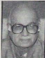
అద్యాని కూడ ఇంత అన్యాయంగా ప్రవర్తిస్తాడని ఎవరూ ఛాంచగలడు?

అదరణకు మనదు భద్రతను చిహ్నంగా ముస్లింలు భావిస్తూ; మైనారిటీల