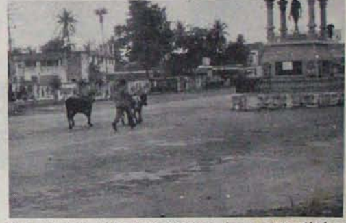
కనరానికి మనుషులన్నూ దొంగకాంబి దొమ్మ వర్షవకపుం పైలాకి ప్రాణం ప్రదర్శిస్తూ జీవించారు