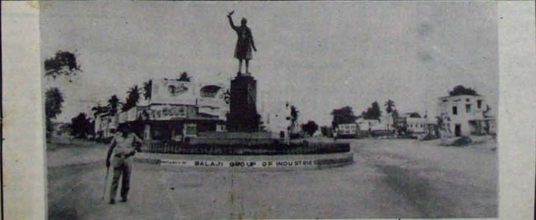
అందరికీ దొంగ పోయిన ప్రాంతం కోమలా వీధి పున్న కాన్స్టిబిల్ - ముఖం బహుమతి దగ్గర నిర్మానుష్యం చేసింది!