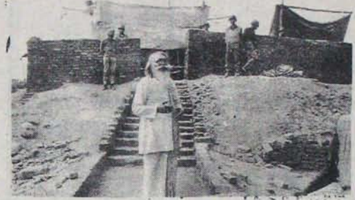
దీనినించి 6 తేదీ బాట్రి మనదు రూపుమాపి పోయి, దాని స్థానంలో వెలసిన రామాలయం; మెట్ట పై నిలబడి వున్నది అలయ ప్రధాన పూజారి

కరనేపకు కావలసిన ఏర్పాట్లన్నీ చేయించారు. పోలీసులు ఏమి జరిగినా కాల్పులు జరపరాదని కళ్యాణసింగ్ ఉత్తర్యుచారంపైనే వారికుటల ఆద్రం చేసుకోవచ్చు. దీనినించి ఏతేదీ నాటికి కరనేపకుల సమాకరణ, నాయకుల రాక జరిగిపోయాయి. ఆరాత్రి క్రియాశీలక కార్యకర్తలకు రహస్య అడ్డాయి వెల్లాయి. పొద్దున పోలీసులు మౌన ప్రెక్కుల వలె నిలబడి చూస్తుండగానే కరనేపకులు మనదు నైపుణ దూసుక వెళ్లారు. దీమల బాదులవలె సాగిన ఆ కరనేపకుల ప్రవాహాన్ని నిరోధించడానికి ఏ పోలీసా ఏ ప్రయత్నమా చేయలేదు. అద్యానినవంటి నాయకులు ఒక ప్రక్క ఉపన్యాసాలు దుంచుకుంటే, ఇంకోక ప్రక్క పీదు త్రాచాలి, కొడవట్ల గద్దవారలు