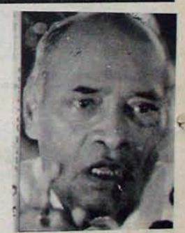
సామరస్యం కోసం తమింది నవస్యలు కొవి తెచ్చుకొన్నాడు.