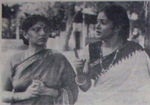
పల్లె పుస్తకాన్ని అందించిన సమయంలో