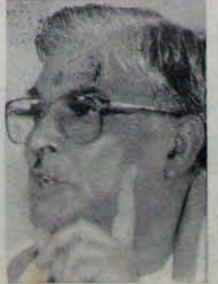
దేశద్రోహిగా పిలువదగిన దీనిని వేక మురింపనీవారే తమ

పట్టుకొని మనదును నేలమట్టం చేశారు. లోపలున్న రామాలయ విగ్రహాలు చూపుతూ మాయమైనాయి. మనదు పునాదులలో సహా ద్వంసమై, మతం అలయ నిర్మాణానికి చేరిక సిద్దమైన తర్వాత మంత్రించినట్లు తిరిగి ప్రత్యక్షమైనాయి. దాదాపు లక్ష మంది కరనేపకులు ఒక పగలు, రాత్రిలో వానత సేననలె వనిచేసి మనదును మాయంచేసి, రామాలయ నిర్మాణం ప్రారంభించారు. నాలుగు ప్రక్కలా అరచగుల ఎత్తు గగణం, వేదికపైకి సాలాతమెట్లు ఎక్కరాయి. కొత్తగా అయోధ్యకు వెళ్లినారు ఆ ప్రదేశంలో మనదు వుండేదని చెప్పినా నమ్మలేని విధంగా, నామయాసాలు లేకుండా చేశారు. అప్పటివరకు ఉత్తర ప్రదేశ్ ప్రభుత్వం ఈ కార్యక్రమాన్ని కొరవై కై పట్టే