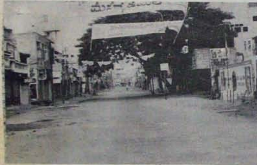
కర్ఫ్యూ పుణ్యం అనంతికలాపురు మంటున్న నెల్లూరు (టూకల్) పు

83వ ఉదయం మిక్త వకాలు బంద్ ప్రకటించాయి కర్ఫ్యూ అమలులో పుండడంతో బంద్ దానంతట అదే విజయవంతమైంది. అలోచనా పోలీసుల బెడద తప్పలేదు. పిటిలోకి వచ్చినవారిని వచ్చినట్లు కలిపివట్టారు. కొత్తగా రిక్టోరత్ అయిన కాన్స్టిబిల్లటూ - వారికి 'మావెత్త సప్తదా' పుండింది- లాటిలు విసరతం! వెంకటేశ్వరపురం కూడలిలో ఈనాడు