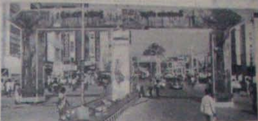
కళాత్మకంగా నిర్వహించిన స్వాగత ద్వారాలలో ఒకటి

కన్పించింది. మనమోహన్ సింగ్ అయితే చేతిలో కాగితాల కట్ట పట్టుకొని, వంజాద్ నుంచి వచ్చిన సాధారణ ప్రతినిధి మాదిరి తిరుగుతుండనారు. ప్రధాని శ్రీ పి.వి. 14 నుంచి 16 వరకు పాపాంత్రం పరశు భేరిక దిగితే ఒట్టు పద్యాననం వేసుకొని గంటల తరబడి ఆట్టి కూర్చుండిపోయి, ప్రతి ఉపన్యాసాన్నీ శ్రద్ధగా అలంకించారు. మధ్యమధ్యలో అయ్యవారు ఫారం వెచ్చినట్లు ఉపన్యాసాలు చేశారు. ఇటు ప్రతినిధులు కాని, అటు నాయకులు