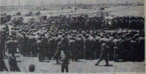
ఆవరణంలో ఏక్కడ చూసినా షోలీసులే!

అంత మందికి భోజనం ఏర్పాటు చేయడం ఎంత కష్టతర కార్యమో అనావలెము. త్రాగేందుకు ప్లాస్టిక్ గ్లాసులు, ఫిల్టర్ చేసిన నీళ్ళ కోసం ఆకృత యంత్రాలు అడి వరంపై కొరవ 12 పేజీలో