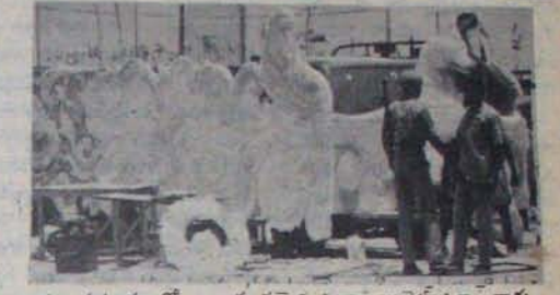
హంసరూపంలో అలంకృతమైన ప్రధాని బుల్లెట్ ప్రూఫ్ వారు

లైతన్యవంతులను చేసిన ఉపన్యాసాలు లైపు. తిరుపతి ఎండలు వచ్చిన ప్రతినిధుల ఆవరి తీశాయి. ప్లీనరీ జరిగి ప్రధాన సమావేశ మందిరంలో తప్ప ఇంకెక్కడను పోయినా చోక్కాలు ర్యయం పూటకు 50,60 వేల మంది జనానికి షేడరౌపిక విండు డౌరు. 14 టైటింగ్ హాల్లో ఉదయం 8 నుంచి రాత్రి 12 గంటల వరకు విరంతర అన్నదానమే. రుమలలో, శుభ్రతలో జనమాత్రం తేడా రాకుండా