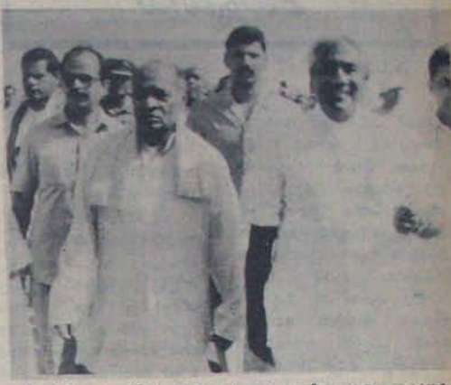
ప్లీనరీ ప్రాంగణంలో ప్రధాని పి.వి. ముఖ్యమంత్రి నేదురుమల్లి జనార్ధన్ రెడ్డి

వివి ప్రభుత్వ అధిక సంస్కరణల వల్ల విదేశీ మారక ప్రద్యాల నిల్వలు 1991 జూన్ నుంచి 1992 ఏప్రిల్ వరకు 2500 కోట్ల నుంచి 15 వేల కోట్లకు పెరిగాయి; ఈ సాహసోపేత సంస్కరణలను కాంగ్రెస్ పార్టీ సంఘర్షణంగా సమర్థిస్తున్నదని తీర్మానంలో