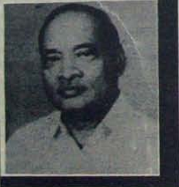
ప్రధానమంత్రి, కాంగ్రెస్ అధ్యక్షుడు శ్రీ పి.వి. నరసింహారావు