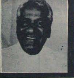
ఆంధ్ర ముఖ్యమంత్రి ఎన్. జనార్ధన్ రెడ్డి గారు