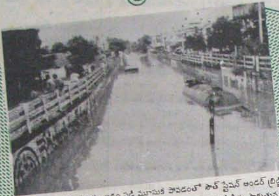
కాలవలన్నీ తెల్ల తెలారం అడ్డం ఏడే మూసుకే పోవడంతో పాత్ స్టేషన్ అండర్ బ్రిడ్జి కాలవగా మారి పోయింది. తెండు వైపులా రోడ్డుకు సమస్థాయిలో నీరు పారుతున్న ప్రక్క ఆ మొంపులో ఎక్కడ పోయిన లాగిలు