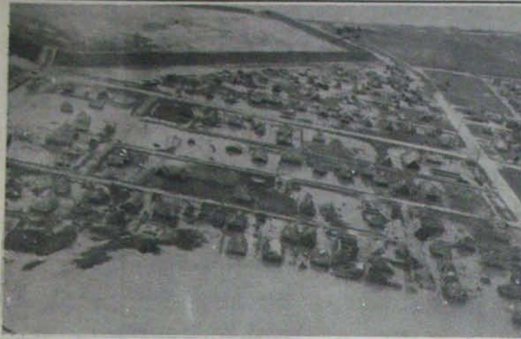
ఈ ఏడు పెట్టుకున్నారన్న కథలతో కూడా వెంకటేశ్వర స్వామి, వెంకటేశ్వర పురాణం రక్షణకు కదిలితాడు; పెన్నె నీటిలో తెచ్చిన వెల తేలుతున్న గుడిగోల దృశ్యం!