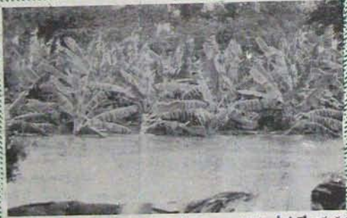
పైన ఏళ్ళదినం - లోపం కుర్చీ పోయిన టోడెలు; నాలుగడుగుల నీటిలో నానుతున్న ఒక ఆరటికోట