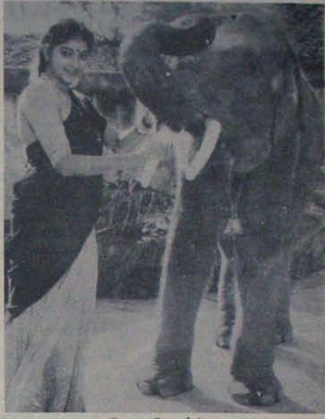
"గంగ" లో సీతార

"కొంతకాలం పోయాక ఈమెతో చిత్రం తీయాలంటే ప్రపంచ బ్యాంకు నుంచి అప్పు ఏ తీసుకోవాలేమో!" అన్నాడట నవ్వుతూ.