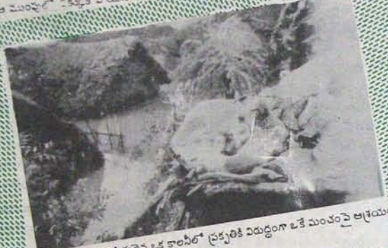
ప్రక్కటి ప్రళయోనికి గురైన ఒక కాలనీలో ప్రక్కటికి విరుద్ధంగా ఒకే మంచంపై ఆక్రయిండ్ పాండి. కలిసే కూర్చుని వున్న కుక్క, పిల్లి!