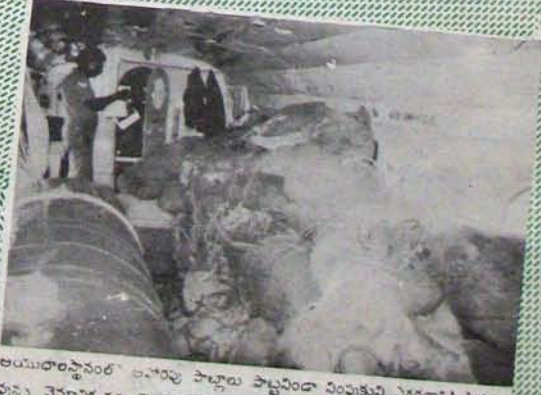
అయిదుదారిస్థానంలో అనారోగ్య పాల్గొలు పొట్టవీరినా వింపుకువి ఎగడంచే సిద్ధంగా వున్న వైమానిక దళం పాలిక్వార్టర్ లోపలి దృశ్యం.