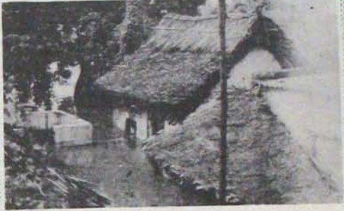
పాత పెద్దాస్పత్రి సమీపంలోని ఒక కాలనీ ఏ దురవస్థలో వుందో చూడండి!