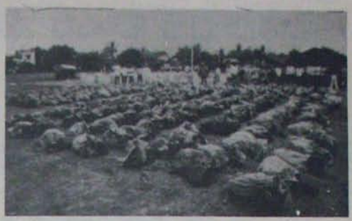
పాపాల్వేల్, అన్నం పాట్లంకో పాటు మంది పేళ్ళ క్యాన్సరు కూడా కలిసి బాధితులకు అందిచారు. వారిని పాలిథియోల్ రోడ్ కేంద్రానికి రెడీ చేసి పెట్టిన దృశ్యం.