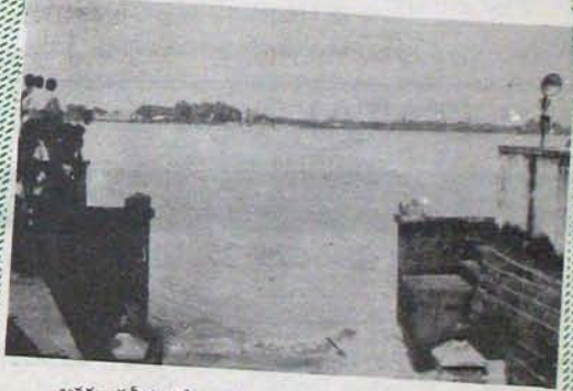
అనకట్ల సమీపంలో ఉరవళ్ళు, వరవళ్ళు త్రోవ్కొలుతున్న పైనమ్మ!