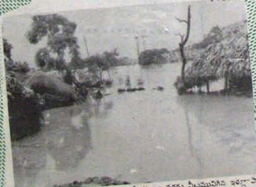
పొట్లకట్ల లోగి పన్నెండవ పైన బడడంతో కప్పలం వరకు నీటమునిగిన ఇల్లా పాత పెద్దాస్పత్రి సమీపంలోని దృశ్యమిది.