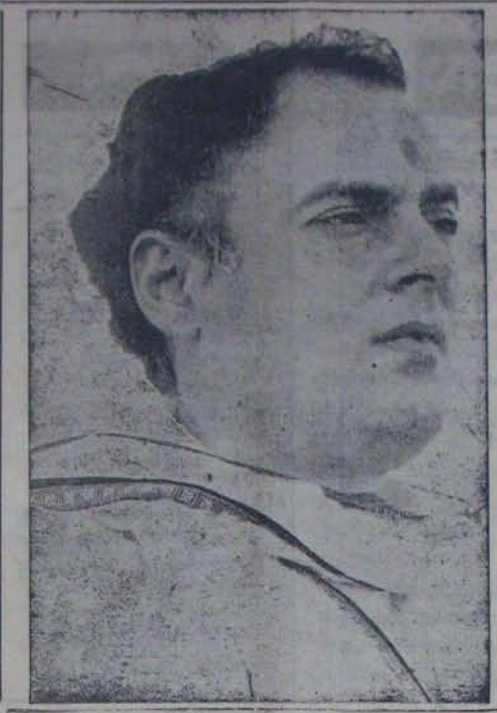
ఇకర సర్వవేళాలూ, ముగింపూ అసందాహం! ఏ మహామేధానిని, ఏ మహాకవిని, ఏ మహాదీని అడిగేదిగా

విశ్వకరణి మన దినవక్రీతం ముఖవక్రీతం ఏమిటి మనం యానూతుంది? కొక్కరాష్ట్రంలో, కొక్కపట్టణంలో, పంపింపరహాయతులు ఉన్నవైవ పాపాశిరి వరకు లోతున్నారో, ఆ సమాజేగదా — ఆ ప్రాంతాటి ఇది పరావన్నీవేంలా భావించవచ్చునా? లేదు, మనదేశం ప్రాంతాటి పరావన్నీవేళాలేగా