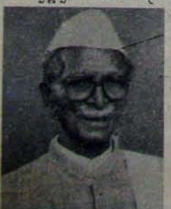
జమీన్దారులు శిరోధారులు ఆచార్య ఎన్.కె. రంగ