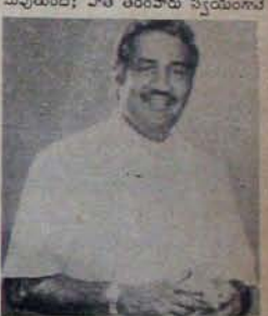
జమీన్దారులు తనదిగా కాంచీ ఆత్మీయుడు ముఖ్యమంత్రి జనార్దనరెడ్డి