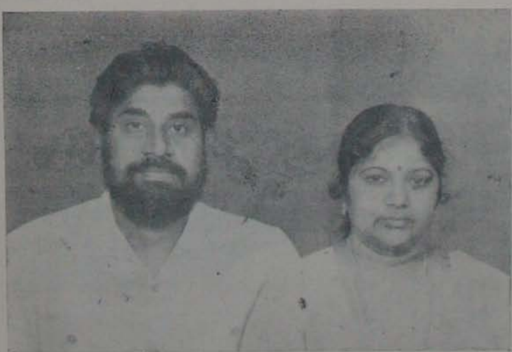
విద్యారంగంలో అత్యుత్తమ అవగాహన, పరిశీలన నిమిత్తం ఆమెరికా వెళ్ళి దిగ్విజయంగా, శుభంగా నెలూరుకు వస్తున్న సందర్భంలో నెల్లూరు సెంట్రల్ స్కూల్ ఫౌండర్, కరెస్పాండెంట్ మరియు వారి సరిమణి