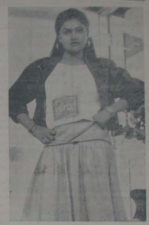
"మహానాసిరీ మరదలుపిల్ల" చిత్రంలో నీరోషా

బాలకృష్ణ పాటలు నిరాకరించారు! బాలకృష్ణ పాటలు నిరాకరించారు! దీనిని తీసుకుంటూనే ఉన్న డబ్బింగ్ చిత్రాల సంఖ్యను పెంచేందుకు ప్రభుత్వం ప్రయత్నించినప్పటికీ, అవి ఫలితం కనబరచలేదు.