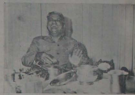
ఎంపరిన్నా ఆరిగింబుపరే నుంబా మీడి