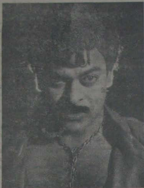
"ఉద్రవేత్ర" లో చిరంజీవి