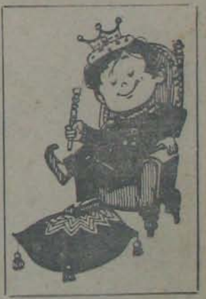
ప్రతి 12 కేకులు మరియు ఆఫైన్ గొన్నవారు ఒకరుబహుమతి మాత్రం పొందగలరు.