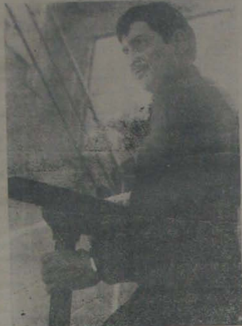
"ప్రజా ప్రసాది"లో కృష్ణ