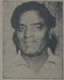
కేంద్ర సమాచారానికి రెండవ తెలుగు మంత్రి పర్వతనేని ఉపేంద్ర

అ కైర్కంలోనే ఎన్టీ ఆర్ రాష్ట్రంలో ఐదేళ్ళ తర్వాత రానున్న ఎన్నికలలో కమరే విజయమన్న విశ్వాసం ప్రకటిం దాడు. అమాత్రం ఆకంపడంలో తప్ప లేదు. అయితే ఐదేళ్ళ తర్వాత ప్రజాపా మనాన్ని తిరిగిపించడానికి దేసిన తప్పలు తిరిగి రేయకుండా వుండాంనన్న వాస్తవం తారవరి వ పేజీలో