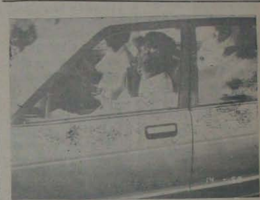
ముఖ్యమంత్రి తొక్కర చెన్నారెడ్డి కార్యకర్తలను కీర్తన పరిచిన విధంబెట్టినన.....ఇట్టింట! జనాభా విభాగంలో చెన్నారెడ్డి.

స్వయంప్రకృత వ్యక్తిత్వం, అధిష్టాన పక్షంలో నిర్విఘాతంసంబంధాలు కలిగిన మల్లు నియామకం చెన్నారెడ్డికి కంటిపై నవ్వించినానే కాదు. ప్రభుత్వ నిర్వహణలో ఆయన స్పీడుకు, ఢిల్లీ ప్రభం వేసిన ప్రకటన దీనిని తా మున్నాడు. మంత్రివర్గం కాల వేటాటలలో చెన్నారెడ్డి వ్యవహరించిన తీరును శేంద్ర నాయకులు గమనించారు. పరిశీలనలు చేసిన పార్. కె. ఎ.టి. తగ్గక సంపాదకుడు పెడ బెదిరబెట్టి ఆయన కనకు మంత్రివర్గాన్ని నిర్మించారు చెన్నారెడ్డి పై కరి మొదటి నుంచి అంబే! కనకు గిట్టని విషయం ఎవరు చెప్పినా ఆయన విన్నవించకుండు; స్వయంప్రకృత వ్యవహారం సాహసము వుంది.