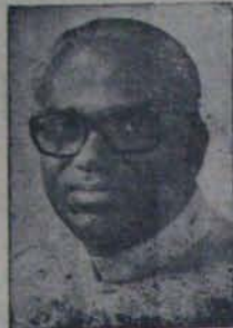
పాపిడిగింటి. శివశంకర్ ను పిల్చిస్తే, అయినా శివశంకర్ కనుకంకం లోకం దారకంపోతుంది, అనార్యవర్గం ప్రయోజనం

కాకినాడలోని 20 వేల ఎకరాల విస్తీర్ణంలోని శివశంకర్ ను పిల్చిందొకరు- ప్యాధాన్యత పొందిందికొకరు!