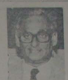
వివేకవంతుల గౌరవసభ 1988 ఏప్రిల్ 10