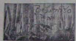
దాదామంచి వైలులు గుర్తించే వుంటారు.

విత్తనాలనుగోలలో ఆదికాళ్ళు త్రి సరసివలె వేరైతే పంకాం ప్రాముఖ్యత అందరూ గుర్తించాలి.