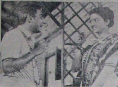
"స్వర్ణకమం"లో బాసుపేయ, సాగ్