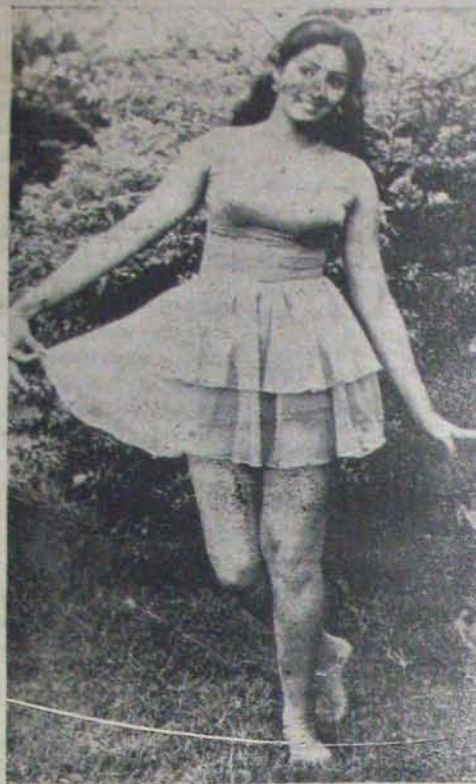
'నువ్వే నా శ్రీమతి' లో శ్రీదేవి