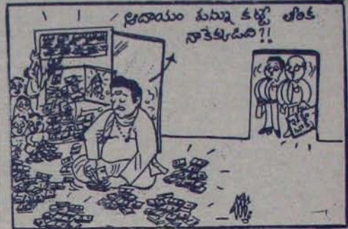
"రాజకీయాల్లో మునిగిపోయినప్పుడు నాకు ఆదాయం వస్తుంది కట్టే తోలిక నాకేక్కడిది!!" ఎన్టీఆర్.

శ్రీ వెంగళరావు స్థానంలో ఆద్యక్ష పద విత్ శ్రీ విజయభాస్కర రెడ్డిని, శ్రీ బాగ రెడ్డిని ఎంపీల రెయిండాలోని వారి పూర్వం మని తెలుస్తున్నది. సమావేశానికి మొత్తం 50 మంది రాజ పోవడానికి భారణం, వారు నగరంలో, రేలం వరకు వెళ్లిన అంటున్నా. శ్రీ వెంగళ రావుకు వ్యతిరేకంగా చవాచాటంగా ముందుకు రావడానికి చాలా మంది సుమోఖర్ ప్రక ర్థించలేదని వివరించి. మళ్ళీ రివరెన్సు కి వ రేడి తిరిగి సమావేశం చేసినట్లు పోడిగా పార్టీ వద్దకు వచ్చినట్లు తెలియజేయడం అసమ్మతి వర్గం పోపులకు తేలికపట్టి, శ్రీ వెంగళ రావు ఆ విషయాన్ని తెల్లగా తాటివేళాడు. — చారవ 14 వ పేజీలో