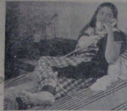
"చిన్నోడు పెద్దోడు"లో ముద్దుల అమ్మ

చిన్నోడు పెద్దోడు అంటే అర్థం మారుతుంది. అందుకే ఈ చిత్రం చూస్తున్న వారికి సామాన్యంగా వచ్చే అర్థం కాదు. ఈ చిత్రంలో చిన్నోడు పెద్దోడు అంటే అర్థం మారుతుంది. అందుకే ఈ చిత్రం చూస్తున్న వారికి సామాన్యంగా వచ్చే అర్థం కాదు.