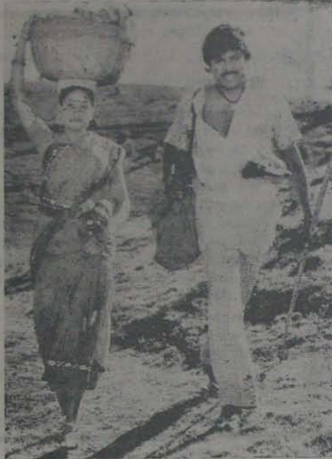
చిరంజీవి - విజయశాంతి