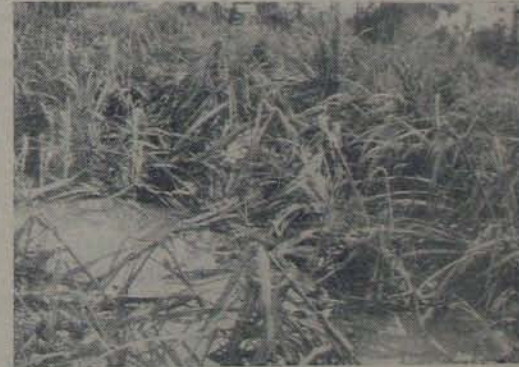
నోటికాడికొచ్చిన చెకకు నేలపొలైంది, తుఫాన గాలికి ధ్వంసమైన చెకకు పైరు.