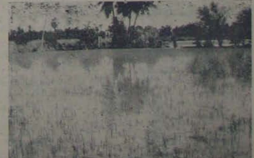
వీట మునిగిన మొంగిలుకు పైరు