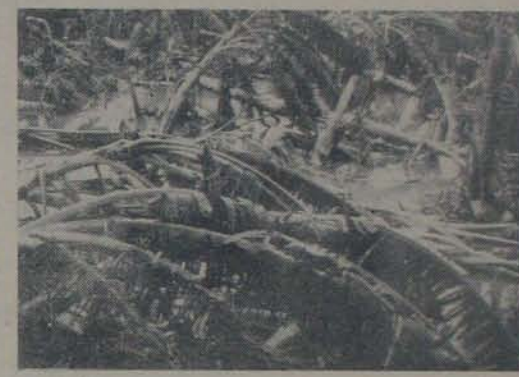
తుఫానుకు ఒక్క అరటిచెట్టు మిగిలేదు. చెట్లు నేలకొరగిన ఒక అరటిచెట్టు ఇది.

కంగా, వలకు తున్న గొంతులో మా గొంతుడు. ఆ కర్మాక సమాచార కార్యక్రమం గురించి కొన్ని వివరాలిచ్చారు కర్మాక శ్రీనివాసులు చెప్పి అందుకున్నాడు. ఆయన కూడా ఈ కథలూ 10 పేజీలో