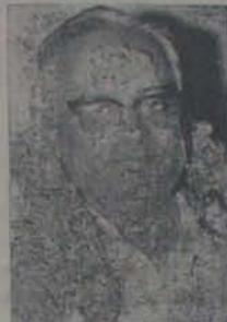
తుఫాను వలన బాధితులకు త-మర్పించాడు.

జిల్లాలను సందర్శించి బాధితులకు త-మర్పించాడు.