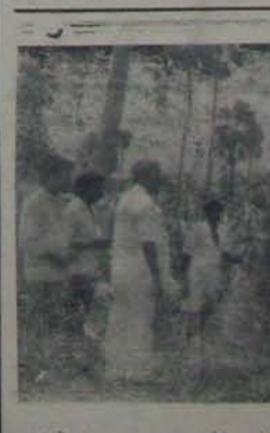
తుఫాను వలన బాధితులకు త-మర్పించాడు.

వారివారల వివరాలు జిల్లాలను సందర్శించి బాధితులకు త-మర్పించాడు.