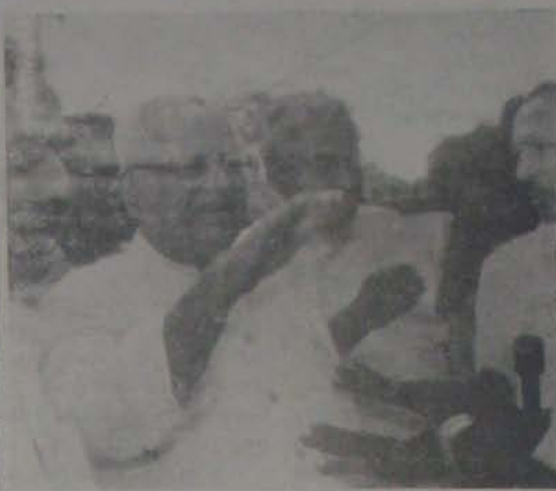
నెల్లూరు నగరపట్టణం సామాజిక సంక్షేమ శాఖ సామాజిక సంక్షేమ శాఖ