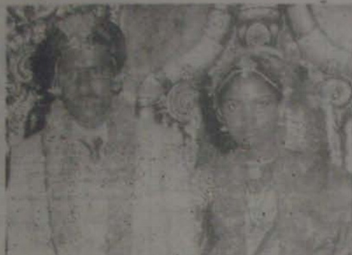
జక్కా శివవారాధనలెడలి, లక్ష్మీవ్రతపన్ను, వీరి పరిచయం 21 తేదీ నెల్లూరులో జరిగింది.