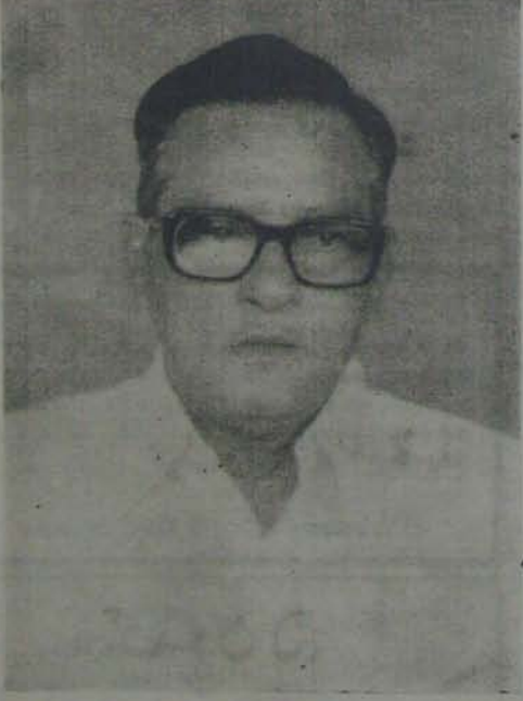
జననం : 8.11.1928 మరణం : 17.8.1987

అది వచ్చింది. అది వచ్చింది. అది వచ్చింది. అది వచ్చింది. అది వచ్చింది.