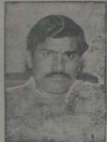
బాబు అంటే భయం

చంద్రబాబును అరెస్టు చేయాలని డిమాండ్ చేస్తున్నారు. అందుకు మద్దతుగా చంద్రబాబును అరెస్టు చేయాలని డిమాండ్ చేస్తున్నారు.