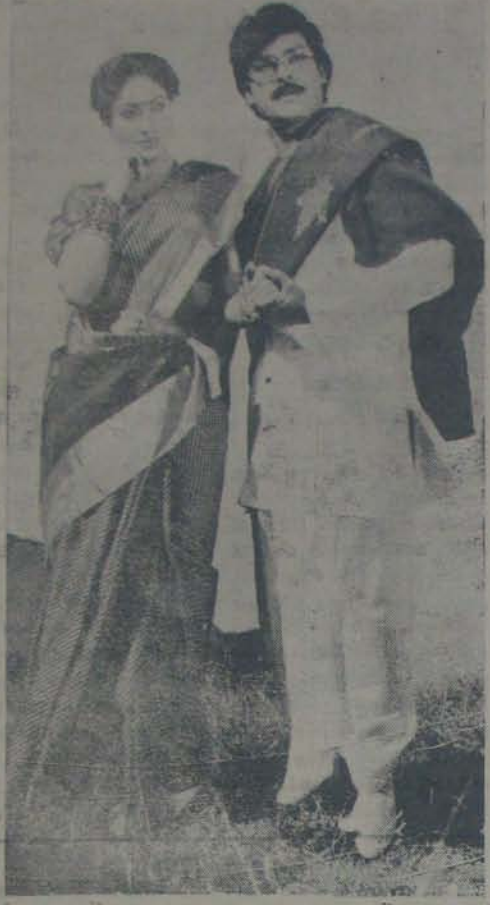
చీరంజీవి - విజయశాంతి 'స్వయంకృషి'