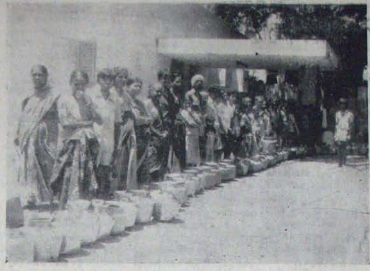
మునిసిపల్ ఆఫీసులో మునిసిపల్ కౌన్సిలర్ల సలహాపై తయారుచేసిన బియ్యం ప్యాకెట్లను పంపిస్తున్న సమయం.

వానలపై ఇక్కడ పూర్తి అలోచనలో ఉన్నామని తెలిపింది. గుండె నొప్పి అవస్థ అయిన విజం అలోచనలో అన్నిటిలో చికిత్స పొందారు. ఇక్కడ మరొకరికీ అలాగే చికిత్స పొందారు. అందువల్ల కాబట్టి ఈ సెలలో శిక్షా పర్యటనలు చేశారు.