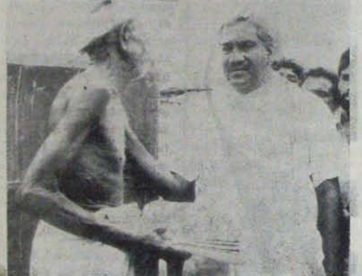
వెలికల్లు అగ్నిపరమాధికారిలు. ఎ. కాం. కర్రపన పద్మదాసం చెప్పుకునే దురుముల్లె అనారంభం