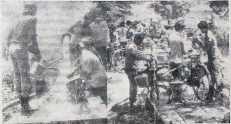
ఫిల్టర్ పాయింట్ ప్రాణదాతలు: సైకిళ్ళు వాటర్ ట్యాంకర్లునాయి!

నెల్లూరులో నీటి కరువు భయంకరం. ప్రజల అగచాట్లు హృదయవిదారకం! నెల్లూరులో నీటి కరువు భయంకరం. ప్రజల అగచాట్లు హృదయవిదారకం! నెల్లూరులో నీటి కరువు భయంకరం. ప్రజల అగచాట్లు హృదయవిదారకం!