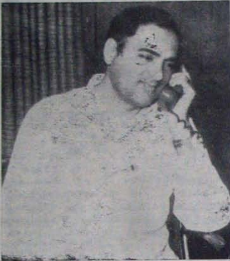
"అదుర్దా వడకండి, జైమంగా పున్నాను!"