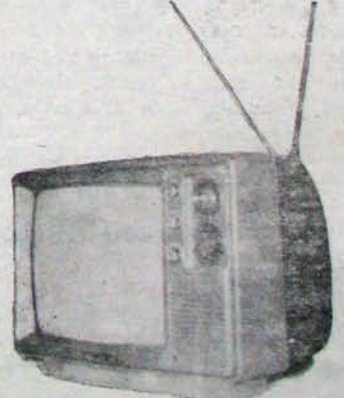
BALAJEE Monomax-14 Portable B. W.

Also B & W 20" Sets with and without Shutters with Competitive Price & Effective After Sales Service. Ready Stocks available. For other Trade Enquires, Please Contact SALES MANAGER, Registered Office