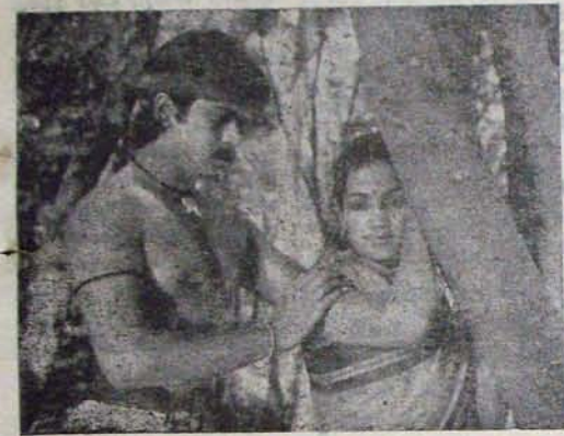
"మనెం"లో మొగడు"లో అర్జుణ్, వెన్నెం

పాల్గొనే జానియర్ అర్జిస్తులకు వాళ్ళు ఏమెంట్లు ఏరోజు కాలాని నిర్మాత దగ్గర్నుంచి వసూలుచేసి, తమకు చెల్లించాలి. నిర్మాత తమకు చెప్పినట్లు అది వెంటనే నిండేస్తాడు? తనే ఆ జానియర్ అర్జిస్తులకు చెల్లించక తప్పదు; అ తనే రేపా దా ఏమెంట్లు అర్జి నేర్పాడేసి, మర్యాద అ నిర్మాత ఆ పీ సు కు వెళ్ళి. "మాకు విజయవాడనుంచి రావలసిన పై కం రాతేడు, నేనేనే చేసేది?" అన్నాడు నిర్మాత. పాపం, ఆ ఏమెంట్లు రెండు రోజులు అగివెళ్ళకూడా అదే సమాధానం వచ్చింది.