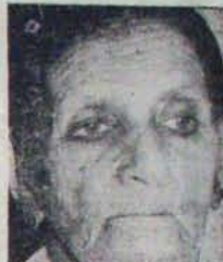
మొట్టమొదటిగా... ఒక సబాల్ పేరిటిన పాటను బేగం

125 సెక్షన్లలో మహమ్మదీయ న్యాయస్థానాలకు మధ్య వైరుధ్యం ఏదైనా ఉందా అన్న విషయం కూడా సుప్రీంకోర్టు వర్గించింది. మహమ్మదీయ న్యాయస్థానాల ప్రకారం భర్త వివాహమైన భార్యకు 'యర్డు' కాలవరకు భరణం ఇవ్వవలసివుంటుంది. 'యర్డు' కు కాలం అంటే ఏడు కులిచ్చేనాటికి భార్య గర్భవతి అయితే ప్రసవం వరకు, మామూలు పరిస్థితులలో 3 నెలలు యర్డు అంటే నిషేధం. ఆకాలంలో భార్య ప్రభుత్వం అవలంబించాలి; పునర్వివాహం చేసుకోకూడదు. సుప్రీంకోర్టు తీర్పులను అనుసరించిన ప్రకృతిగా భావించింది. వివాహమైన భార్యకు పన్నెండు సంవత్సరాల పరిస్థితి ఈ నిర్ణయం వల్ల వచ్చింది. మహమ్మదీయ న్యాయస్థానాలలో కూడా ఎక్కడా అటువంటి పరిస్థితులు ఏర్పడకపోవడం భార్యను పోషించవలసిన అవసరంలేదని ఎక్కడా చెప్పలేదని అందువల్ల క్రిమినల్ ప్రొసీజర్ కోడ్లోని 125 సెక్షన్లకు ముస్లిం న్యాయస్థానాలకు ఎక్కడా వైరుధ్యం