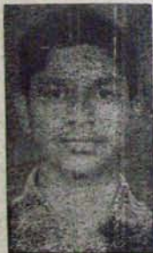
2 వ ర్యాంకు - మెడిసిన్