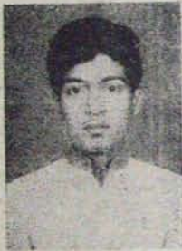
87వ ర్యాంకు - ఇంజనీరింగ్