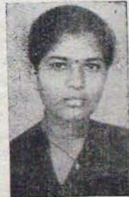
28 వ ర్యాంకు - మెడిసిన్