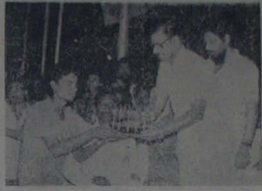
నెల్లూరులో జరిగిన ఎంపిక కార్యక్రమంలో పాల్గొన్న నెల్లూరు జిల్లా పరిషత్తు ఉపాధ్యక్షులు...