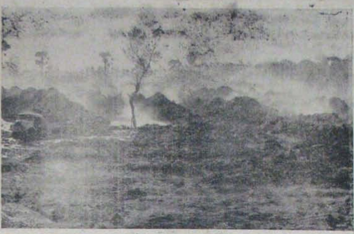
హిమాలయాలవర కబర్ల అట్లల స్మారకవిగార గడ్డివాములు అగ్నిపాలయన దృశ్యం