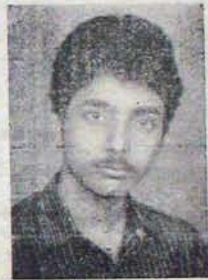
106వ ర్యాంకు - ఇంజనీరింగ్